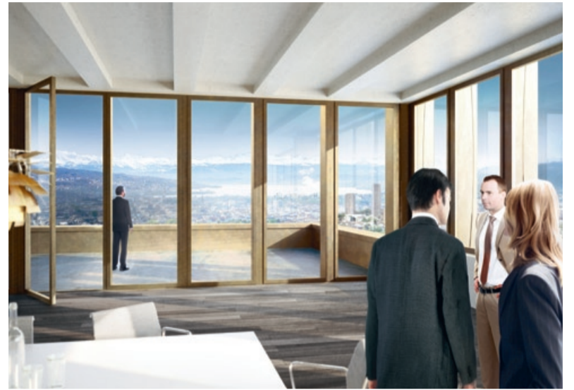
Aussicht aus der 20. Etage des Gebäudes «Wien».

Das Areal verfügt über einen erstklassigen Anschluss an den öffentlichen Verkehr und an den Verkehrsknotenpunkt der A1, A3 und A4. Westlink liegt direkt neben dem Bahnhof Zürich Altstetten. Der Zürcher Hauptbahnhof ist 3 bis 4 Fahrminuten entfernt und in nur 15 Minuten erreicht man den Flughafen Zürich. Mehrere Buslinien und seit Dezember 2011 die neue Tramlinie Zürich-West verbinden das Westlink-Areal perfekt mit Zürich und seiner Umgebung.