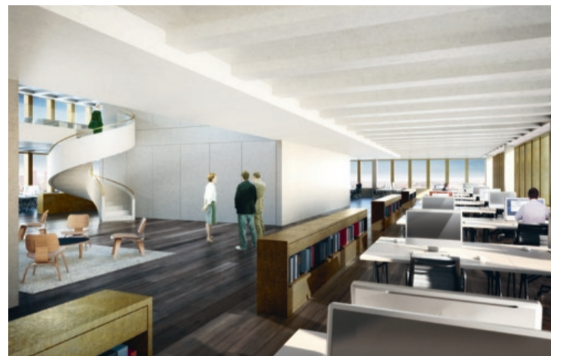
Musterbüro im Gebäude «Wien».

«Westlink ist das einzige Neubauprojekt in Zürich in einer solch guten Preisklasse, welches direkt an einem S-Bahnhof entsteht und so kurze Verbindungen zum Hauptbahnhof garantiert.»