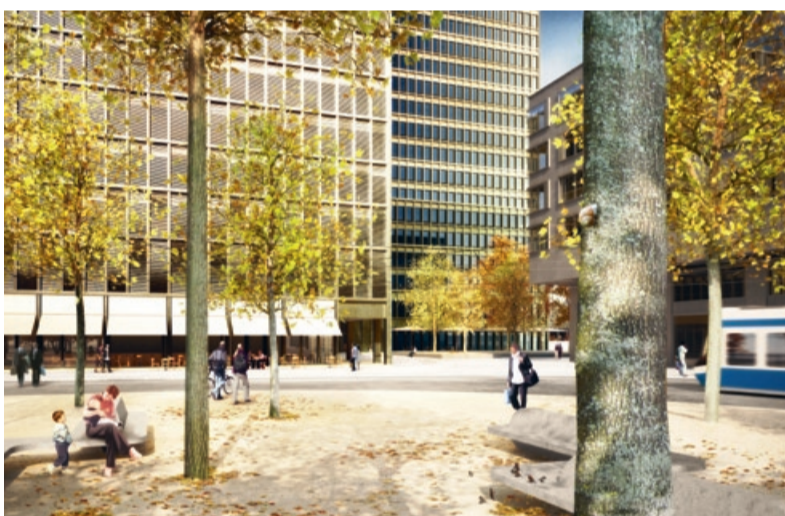
Wendeplatz der Tramlinie Zürich-West.