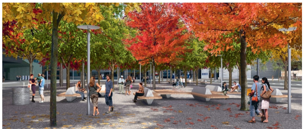
Erholsame Sitzmöglichkeiten unter den nordamerikanischen Ahornbäumen.