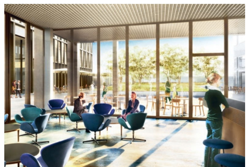
Gastrobetrieb für den Kaffee und andere Verpflegung.

schiedene Infrastruktureinrichtungen für den Bahnhof Altstetten realisiert. Dazu gehören ein attraktiver Bahnzugang, Fahrplaninformationen, Billettautomaten sowie öffentliche Veloabstellplätze.