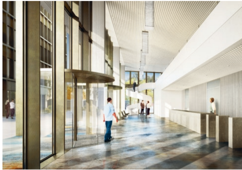
Grosszügige Empfangshalle im Gebäude «Wien».

Das Hochhaus «Wien» wird mit 21 Geschossen zum neuen Orientierungspunkt in Altstetten. Der 80 Meter hohe Bau eignet sich als repräsentativer Firmensitz mit grosser Visibilität und Markenwirkung. Die unteren drei Geschosse bieten Raum für ein zusammenhängendes Kongress- und Gastronomie-